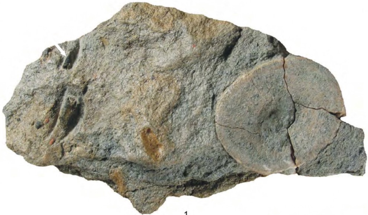
TABLA 1 – PLATE 1