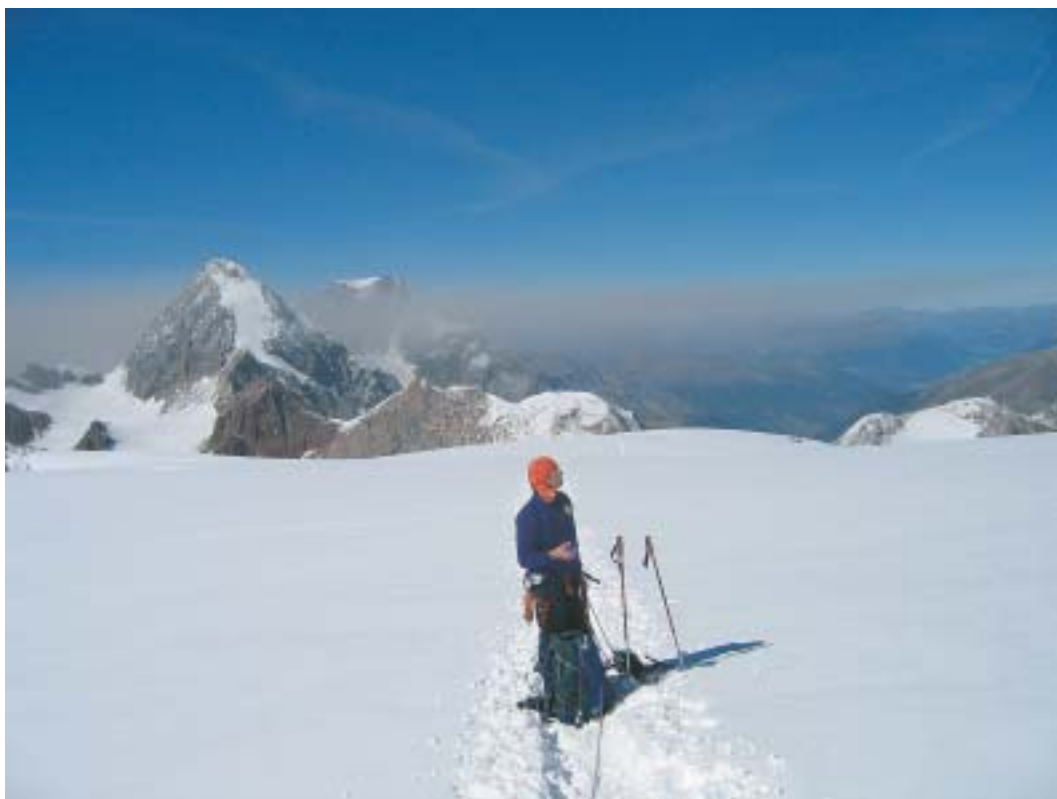
Sl. 11. Po določenem času je veter prah iznad podora zanesel proti severu nad Ortler.

Fig. 11. After some time the dust was blown northwards over Ortler.