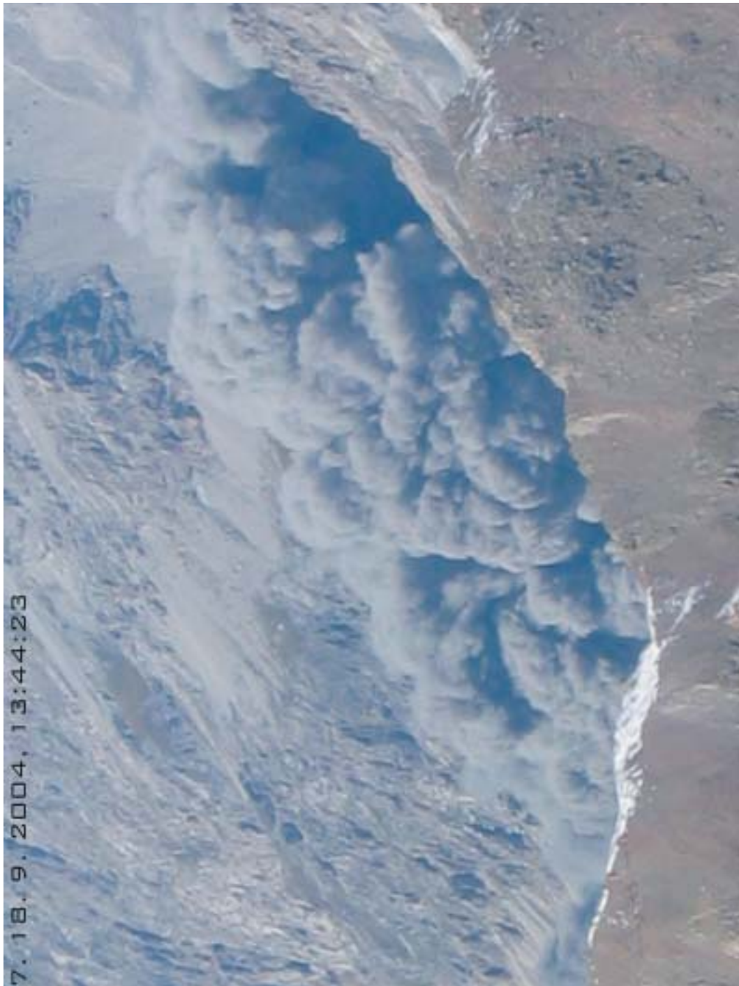
Sl. 6. Ura 13:44:23 Gibanje podorne gmote v dolino je spremljal temno siv oblak prahu.