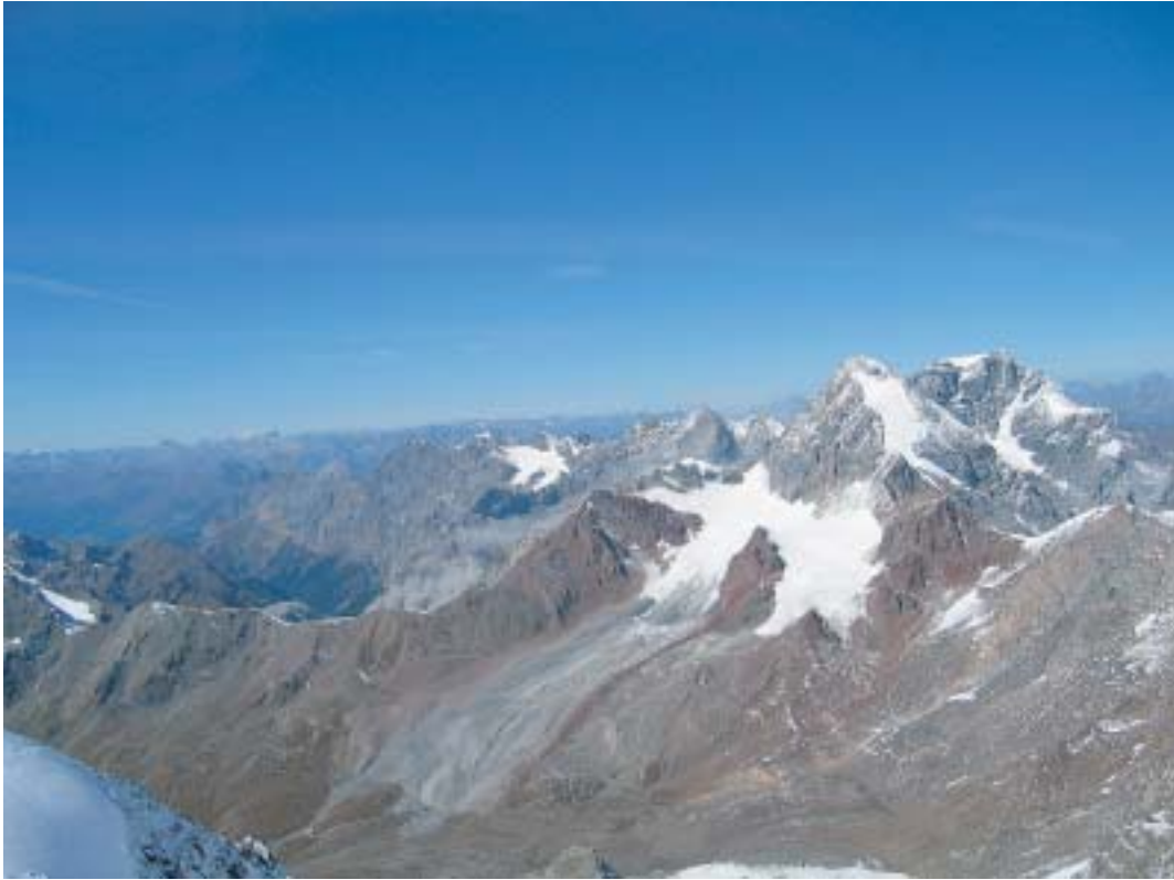
Sl. 9. Prizorišče neposredno po dogodku. Na mestu stebra se je pojavila nekaj sto metrov visoka strma stena. Skrajno levo je oblak temno sivega, v sredini pa svetlejšega prahu. Svetlejša barva oblaka v sredini je verjetno posledica vodne pare.

Fig. 9. Panoramic view immediately after the event. In place of former rock pillar some hundred meters high rock wall appeared. At extreme left a cloud of dark grey and - in the middle - of light grey dust appeared. The latter is probably rich with water vapour.