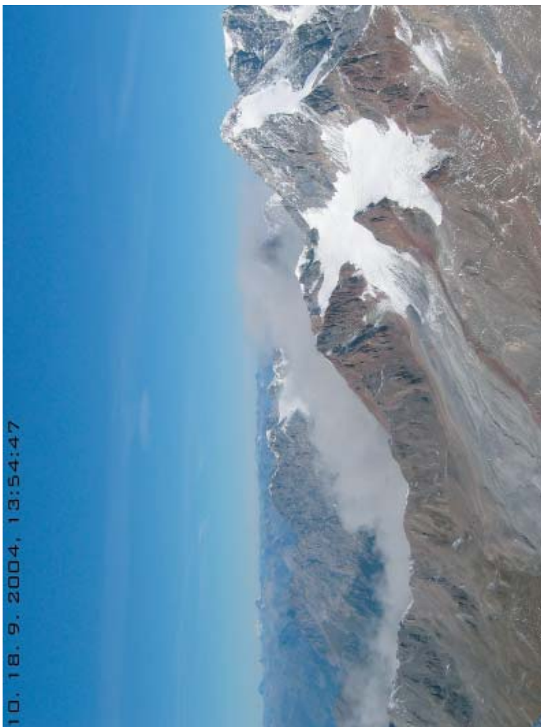
Sl. 10. Ura 13:54:47 Kmalu po dogodku se je celotna dolina zavila v oblaku prahu in vodne pare.