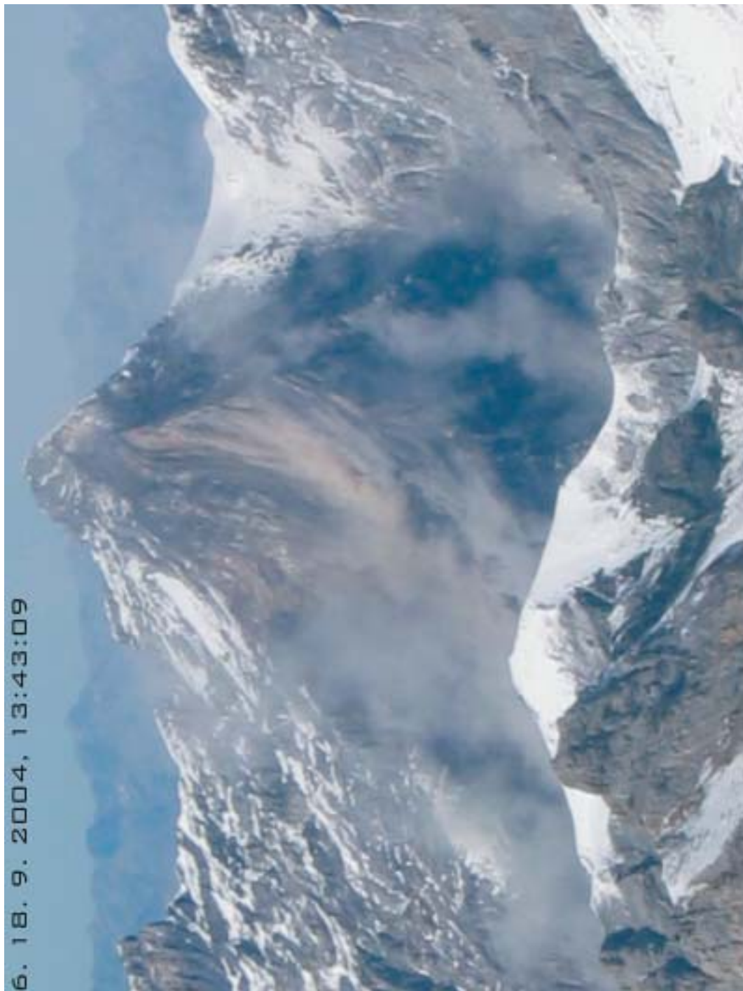
Sl. 5. Ura 13:43:09 Trenutek zdrsa podorne mase v dolino.