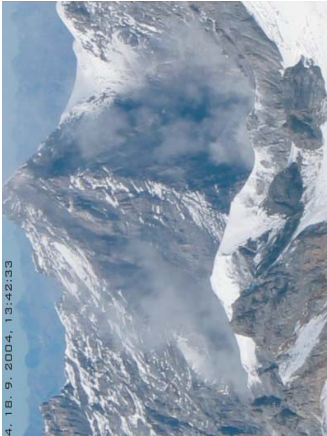
Sl. 3. Ura 13:42:33 Hkrati z odpiranjem razpoke v vrhnjem delu podornega bloka je v spodnjem prihajalo do rušenja gnot.

Fig. 3. Time 13:42:33 Along with the fissure opening in the upper part, rock masses in the lower part were collapsing.