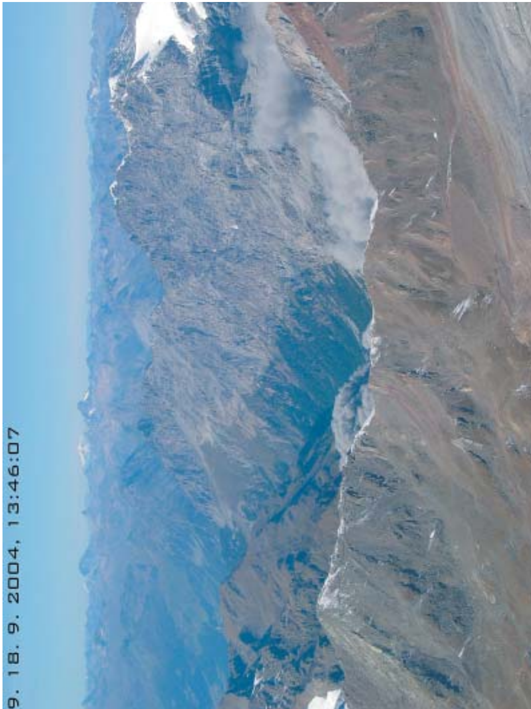
Sl. 8. Ura 13:46:07 Temno siv in za njim svetlejši oblak prahu. Fig. 8. Time 13:46:07 Dark grey cloud and brighter one behind it.