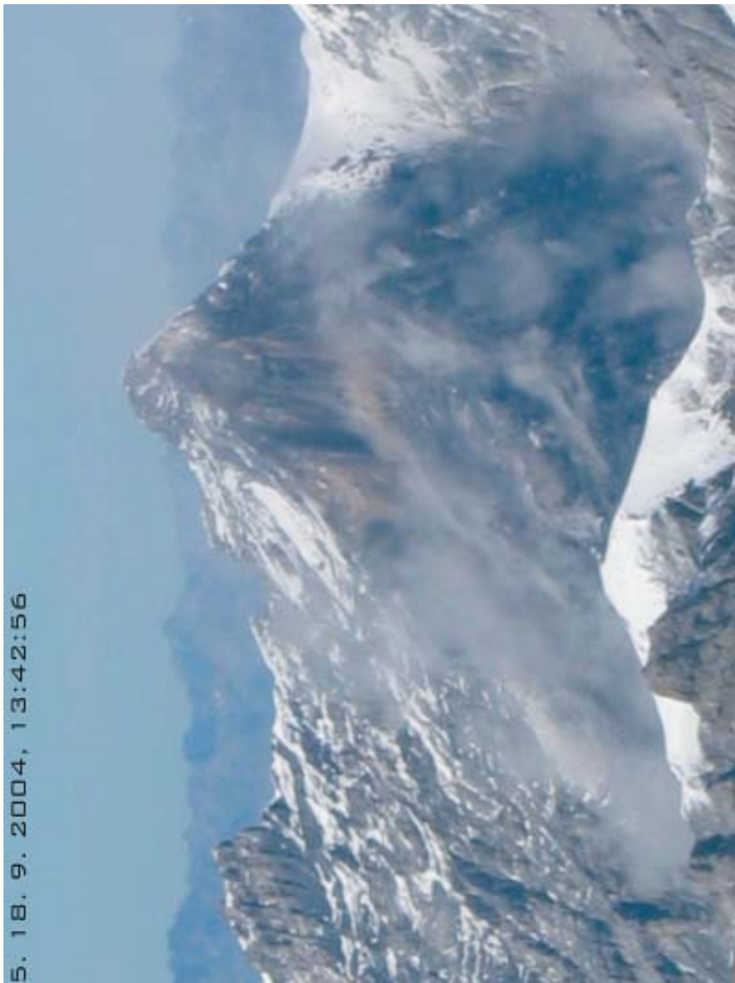
Sl. 4. Ura 13:42:56 Sesedanje stebra. Fig. 4. Time 13:42:56 Collapse of rock pillar.