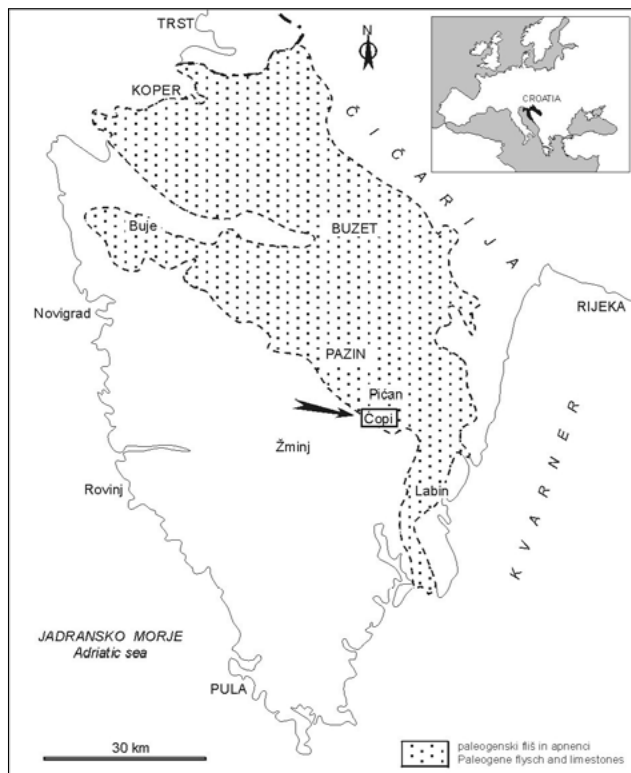
Sl. 1. Geografski položaj najdišča Čopi v Istri Fig. 1. Geographical position of site Čopi in Istria

O najdbah in raziskavah rakovic iz Istre smo že poročali. Iz Gračišča pri Pazinu smo predstavili večjo rakovico vrste Harpactoxanthopsis quadrilobata (Desmarest) in skromen ostanek vrste Lophoranina marestiana (König) (MIKUŽ, 2002; 2004), iz Čopija smo imeli v raziskavah več primerkov vrste Lophoranina marestiana (König), karapaks vrste Lobonotus ? euglyphos (Bittner), (MIKUŽ, 2010 a; 2011) in karapaks vrste Cyrtorhina globosa Beschin, De Angeli & Tessier, 1988 (MIKUŽ, 2010 b).