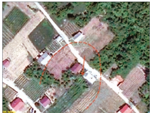
Sl. 2. Približne meje plazu Fig. 2. Approximate contours of a landslide

V neposredni bližini podorov pod Šempavelsko goro se je leta 2003 sprožil plitev zemeljski plaz (slika 2). Plaz, širok okoli 50 m in dolg 60 m, je nastal v vinogradu na osrednjem delu jugozahodnega pobočja z naklonom 20°–30° (DOKL & ZORIČ, 2003). Pri tem so bili poškodovani vinograd, javna pot, oporni in podporni zidovi (slika 3) ter trije objekti (zidanice), od katerih so morali enega kasneje porušiti v celoti. Z vrtnanjem so na območju plazu določili sestavo preperinskega pokrova, ki je debel dobre 4 m. V preperini se po-